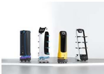
人手不足解消のサービスロボット