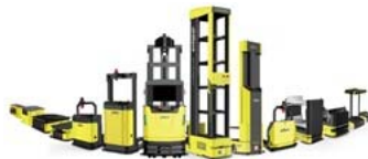
最新自動搬送ロボット