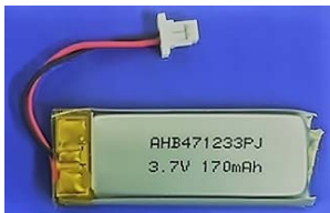
リチウムイオン電池