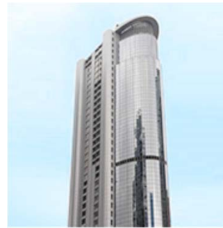
卓華電子(香港)有限公司