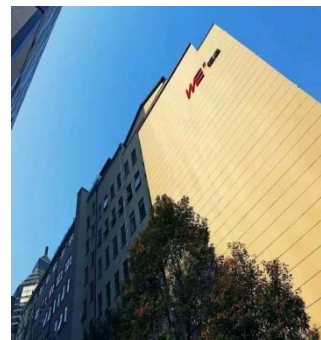
卓英國際貿易(上海)有限公司