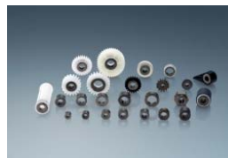
ワンウェイクラッチ