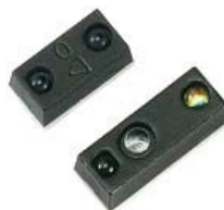
光半導体 (近接センサ)