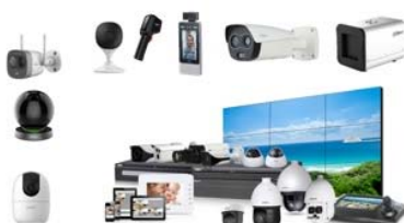
AIカメラ・セキュリティカメラ