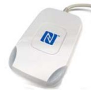
建設キャリアアップシステム ICカードリーダー