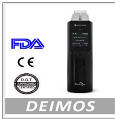
スマートフォン連動 アルコール検知器