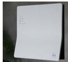
光触媒 除菌・消臭デバイス